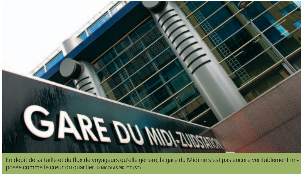
En dépit de sa taille et du flux de voyageurs qu'elle génère, la gare du Midi ne s'est pas encore véritablement imposée comme le cœur du quartier. © NICOLAS PIRLOT (ST).

S' installer à une petite table de Midi Station, le restaurant « branché » d'Antoine Pinto, est un magnifique poste d'observation pour tester l'animation qui règne au alentours de la gare du Midi, à Bruxelles. Le beau temps étant de la partie, de petites échoppes de fruits et fromages s'installent, de passants déambulent calmement. Il est vrai que l'on est en période de vacances, du moins pour certains. La mutation de la gare du Midi et de ses quartiers avoisinants, entamée en 1992, semble avoir franchi une nouvelle étape. L'étude urbanistique d'Euro Immo Star, qui devrait être bientôt approuvée, sera prochainement dévoilée. Son objectif : faire de la gare, le véritable cœur du quartier. Plus qu'un simple centre de transit, elle entend réaliser un équilibre entre son caractè-