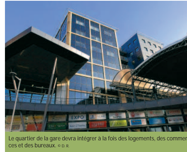
Le quartier de la gare devra intégrer à la fois des logements, des commerces et des bureaux.

rue Fonsny. La SNCB a revendu à Eurostation certains terrains autour de la gare et plusieurs de ses bâtiments administratifs. Un nouvel immeuble pourrait être construit au-dessus des voies, ce qui permettrait de libérer des surfaces. « En faisant appel à l'architecte français Jean Nouvel, nous avons voulu lancer une nouvelle étape pour vraiment dynamiser le quartier du Midi, explique Herwig Persoons. Nous entendons privilégier une approche de très haut niveau, impliquant une intervention créative, monumentale dans le bon sens du mot, pour vraiment attirer l'atten-