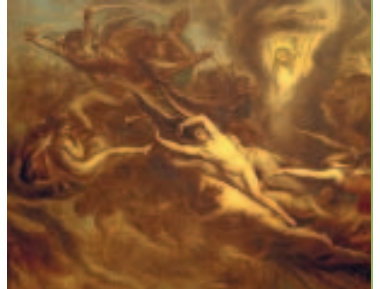
Antoine Wiertz, Le Triomphe du Christ.

A la découverte des donations et legs qui ont enrichi le patrimoine belge. Pages 23 & 24