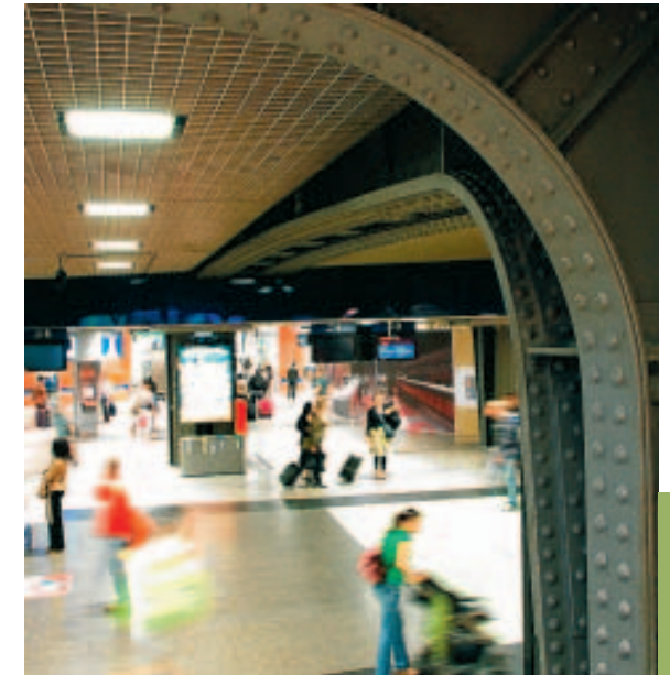
L'accessibilité de la gare laisse aujourd'hui à désirer.

Relier des communes comme Saint-Gilles et Anderlecht n'est pas toujours évident. Les sensibilités sont souvent fort différentes. Les habitants entendent eux aussi avoir